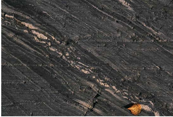
Kuva 3. Uutelan läntiset rantakalliot ovat alun perin kerroksellista tulivuoren tuhkaa (nro 1123). Jäätikön tekemät uurteet näkyvät kuvassa vaakasuorina.