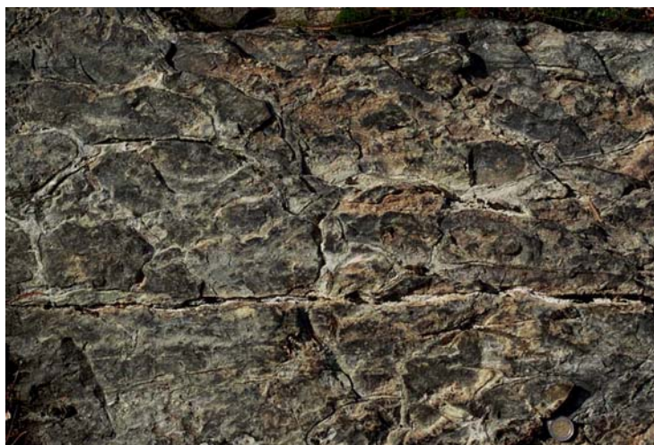
Kuva 2. Tyynylaavarakennetta Vuosaaren vulkaniitissa (nro 1121).