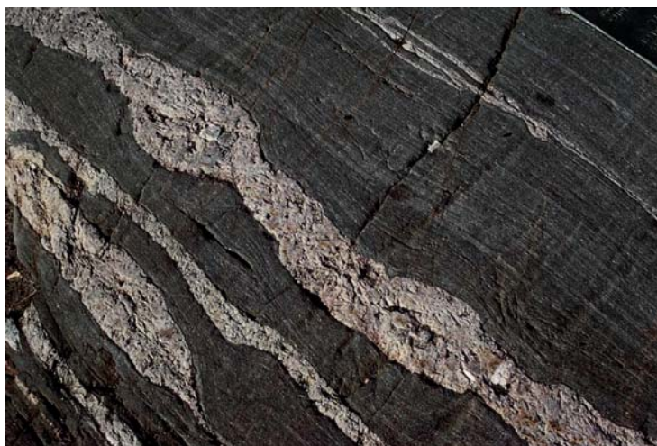
Kuva 1. Raitaista migmatiittia eli suonigneissia Kaivopuistossa (nro 1103).

Kivilaji- ja mineraalikohteiden arvoa vähentävät tuhoutumisen ja peittämisen lisäksi likaantuminen ja jäkälöityminen.