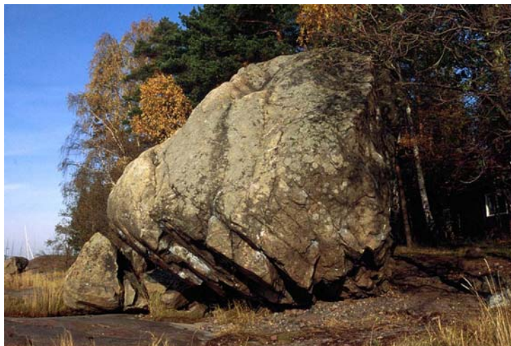
Kuva 14. Viisi metriä korkea lohkare Koivusaassa (nro 2208). Lohkareesta on irronnut kappaleita.