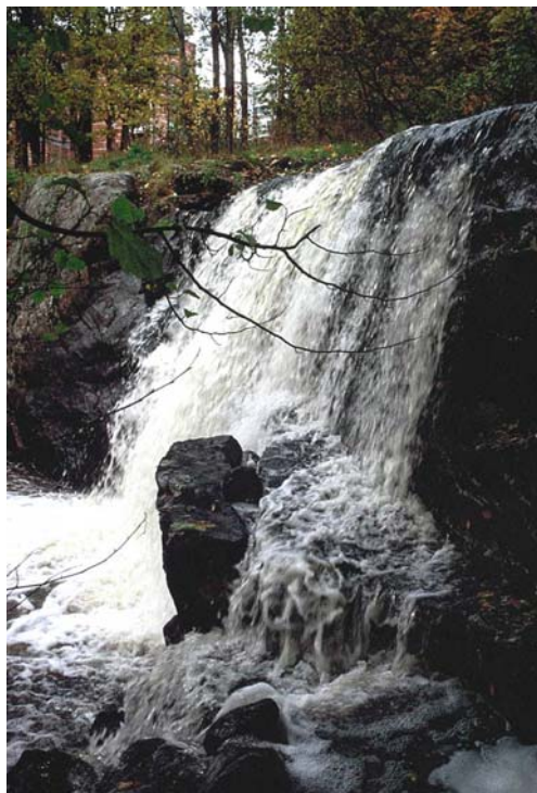
Kuva 8. Mätäjoki muodostaa kalliojyrkänteeseen (nro 1431) vesiputouksen.