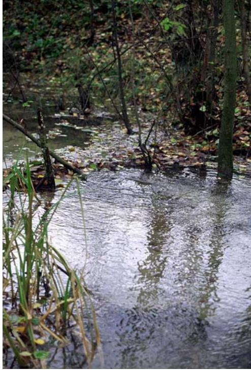
Kuva 16. Tattarisuon lähde (nro 2412) pulppuaa näkyvästi kuivinakin aikoina.