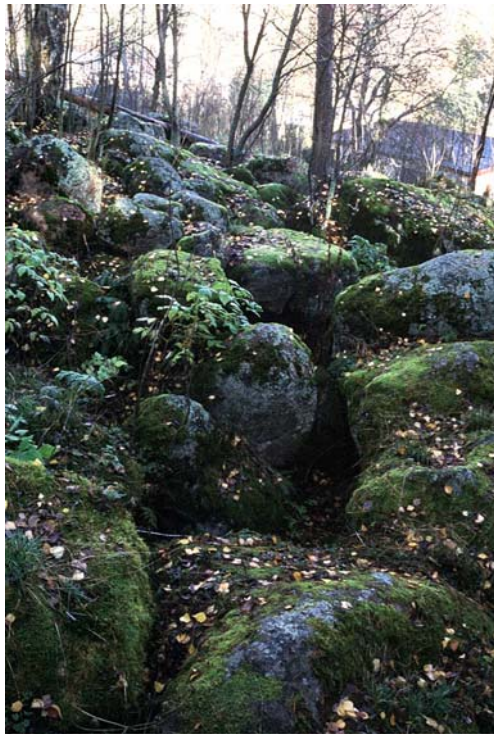
Kuva 13. Litorina-meren lohkarista rantavallia Rastilassa (nro 2118).

Itämeren eri kehitysvaiheita edustavia rantamuodostumia, yleensä rantakivikoita, on Helsingissä melko paljon, mutta ne ovat usein pieniä. Ainoat Yoldia-meren ranta merkit on Jakomäen (nro 2111, kuva 12) ja sen eteläpuolella olevan Pohjois-Kivikon (nro 2113) rantakivikot noin 60 metriä nykyisen merenpinnan yläpuolella. Seuraavaksi nuorimman Ancylus-järven rantavalleja noin 45 metrin korkeudessa on ainakin Käpylän taivaskalliolla (nro 2110) ja Jakomäen Kaivantopuistossa (nro 2112). Enin osa Helsingin muinaisrannoista on Litorina-meren aaltojen huuhtomia kivikoita noin 17–20 m merenpinnan yläpuolella. Esimerkkinä vielä nuoremmista muodostumista on Laajasalon uimarannan hiekkainen rantavalli (nro 2116) muutaman sadan vuoden takaa.