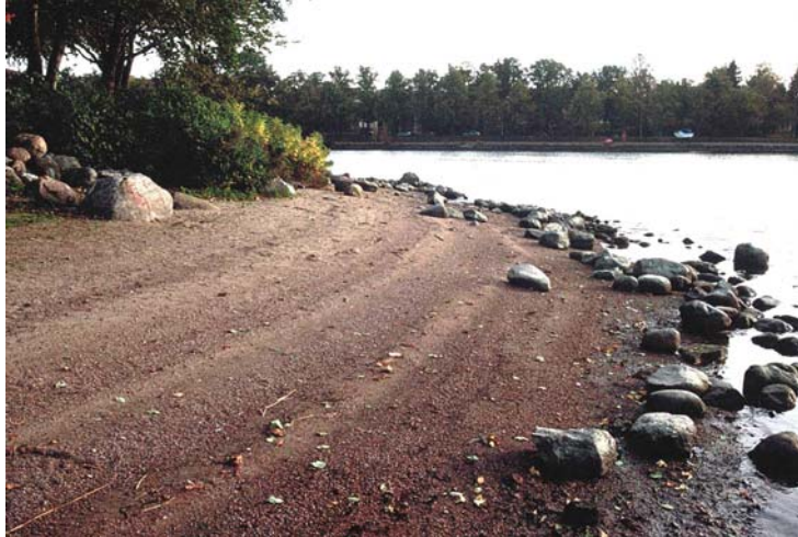
Kuva 18. Siltasaaren länsipäässä on säilynyt pieni hiekkaranta (nro 2605).