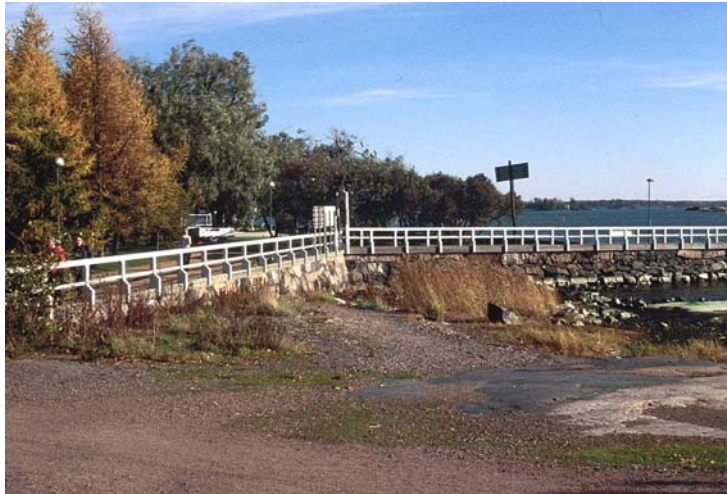
Kuva 17. Pieni hiekkaranta Kaivopuistossa (nro 2601).

Tässä selvityksessä on mainittu todennäköisesti suurin osa Helsingin lähteistä. Lähteitä uhkaavat rakentaminen sekä pohjaveden määrän ja laadun muutokset.