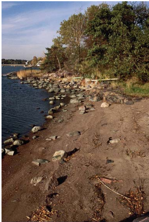
Kuva 19. Toivo Kuulan puiston hiekkaranta (nro 2608).