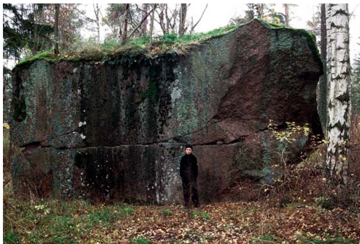
Kuva 15. Vartiosaaren rapakivilohkare (nro 2216) on Helsingin suurimpia.

Parhaiten kehittyneet rantamerkit on luetteloitu tässä, mutta pienempiä tai heikommin kehittyneitä muodostumia on vielä löydettävissä sopivista kohdista. Koska näiden muodostumien kivet ovat yleensä tasakokoisia ja sileäpintaisia, niitä on aiemmin kerätty läheisten pientalojen ja huviloiden kivijalkoihin ja pengerryksiin. Niitä on voitu käyttää myös hautakumpujen tekemiseen pronssikaudella tai kivettyjen tykkitaiden rakentamiseen 1900-luvun alussa. Rakentamisen ja roskaantumisen lisäksi näillä muodostumilla ei ole muita merkittäviä nykyisiä uhkia.