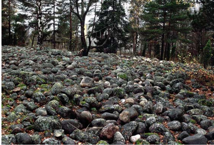
Kuva 12. Yoldia-meren rantakivikkoja Jakomäen huipulla (nro 2111).