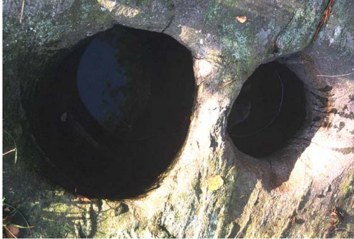
Kuva 5. Roihuvuoren hiidenkirnut (nro 1213) ovat lähes kiinni toisissaan ja suhteellisen syviä.