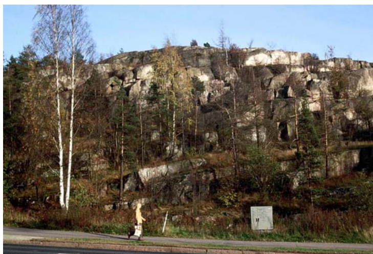
Kuva 9. Pihlajamäen vanha graniittilouhos (nro 1504).