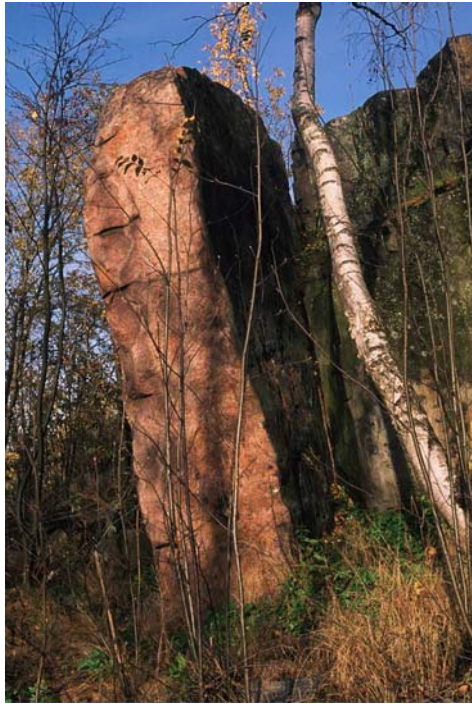
Kuva 4. Esiin louhittu graniittijuoni (nro 1126) Roihuvuoren vanhassa liuskelouhoksessa (nro 1517).