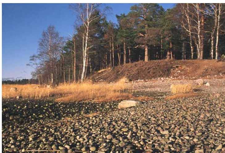
Kuva 11. Meren huuhtomaa kivikkoa Tahvonlahden harjun (nro 2103) eteläkärjessä.

Jätkäsaaren kalliota on näkyvissä nykyisessä Ruoholahdessa (nro 1606), ja Sompasaaren satamatäyttöjen alle jääneen Nihti-nimisen saaren eteläistä rantakalliota on jäljellä sataman eteläkärjessä (nro 1617). Myös Ursinin kallio (nro 1601, kuva 10) on jäänne alueen luonnontilaisesta rannasta. Ruoholahden pienen Kaapelipuiston kallion (nro 1607) luonnontilaisuus on epävarma.